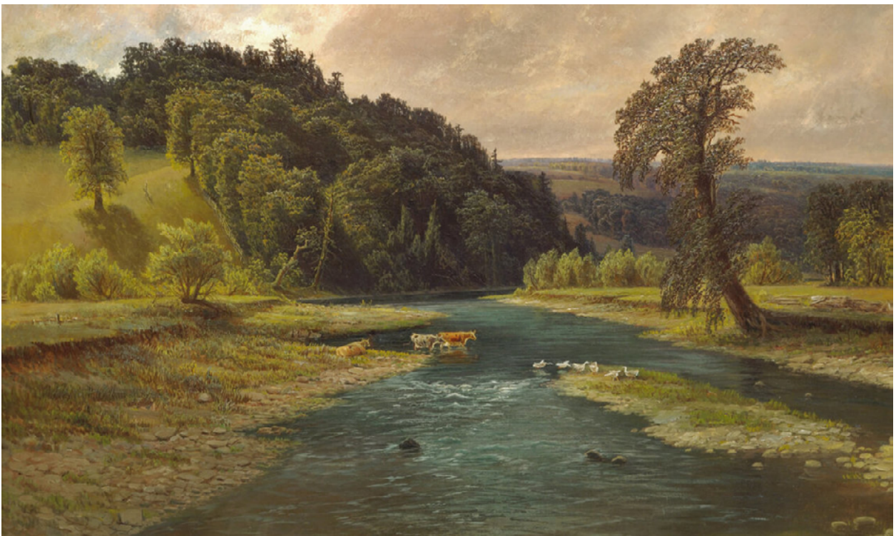
Homer Watson, Grand River Landscape at Doon ( Paysage de la rivière Grand, à Doon ), v.1881, huile sur toile, 96,5 x 142,6 cm. Collection du Musée des beaux-arts de Winnipeg, don du lieutenant-colonel H.F. Osler (G-47-164a).

Je partage mes observations avec l'enseignant(e), ou je les publie sur un forum de discussion collaboratif selon ce qui est demandé.