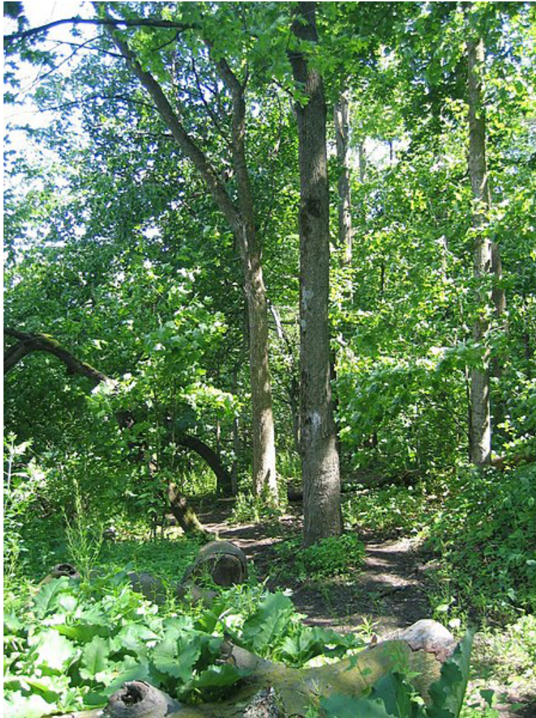
Un arbre du Homer Watson Park.

Je partage mes observations avec l'enseignant(e), ou je les publie sur un forum de discussion collaboratif selon ce qui est demandé.