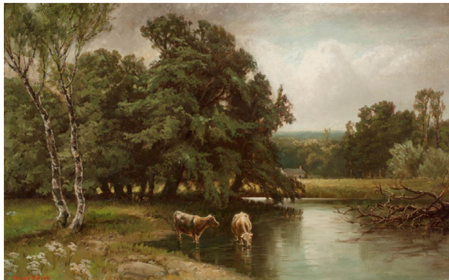
Homer Watson, Two Cows in a Stream (Deux vaches dans un ruisseau) , v.1885. Collection de la Maison-musée Homer Watson, Kitchener.