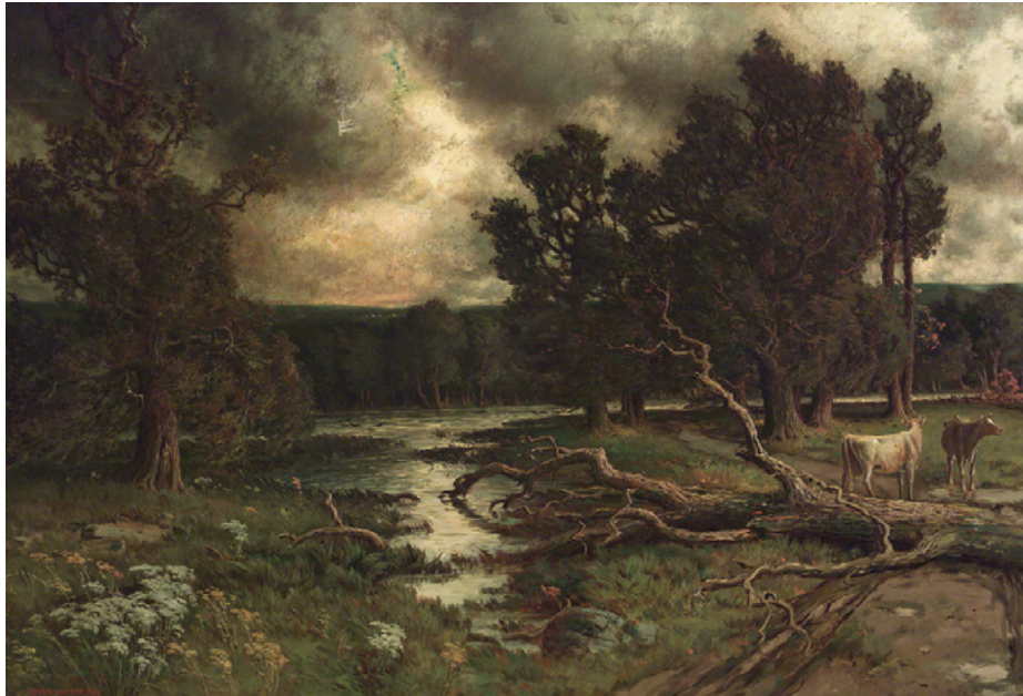
Homer Watson, Near the Close of a Stormy Day (Vers la fin d'un jour d'orage) , 1884, huile sur toile, 96,5 x 142,6 cm. Collection du Musée des beaux-arts de Winnipeg, don du lieutenant-colonel H.F. Osler (G-47-164a).

Je partage mes observations avec l'enseignant(e), ou je les publie sur un forum de discussion collaboratif selon ce qui est demandé.