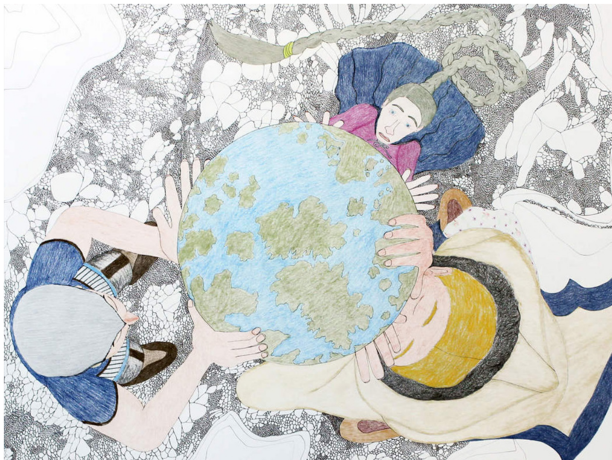
Shuinai Ashoona, Composition [Holding Up the Globe] (Composition [Tenir le monde à bout de bras]) , 2014, encre et crayon de couleur sur papier, 95,3 x 120 cm, collection de BMO Groupe financier.

Meilleurs vœux pour le retour à l'enseignement en 2022.