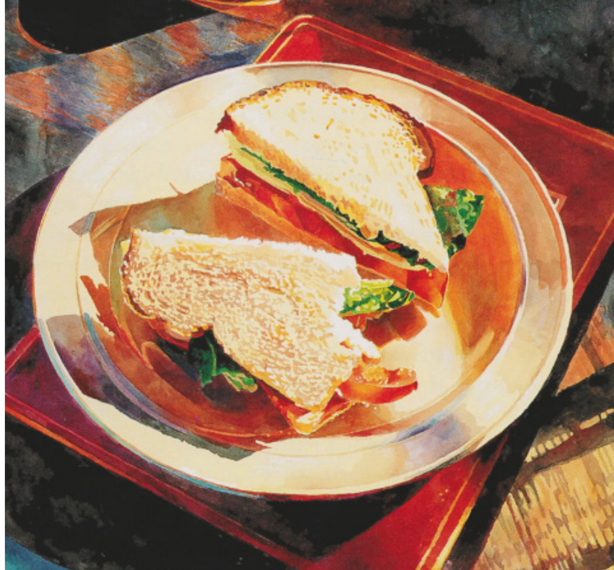
Mary Pratt, Ginger Ale and Tomato Sandwich No. 1 (Ginger Ale et sandwich aux tomates n° 1) , 1999

Mary Pratt (1935-2018), peintre consacrée de la vie domestique, est connue pour ses natures mortes magistrales qui expriment les propriétés de la lumière. L'œuvre Ginger Ale et sandwich aux tomates n° 1 est exemplaire du talent de Pratt à observer et représenter minutieusement la façon dont la lumière rebondit ou se courbe, quand elle se pose sur des objets simples, apparemment banals, comme un sandwich et un verre de liqueur. L'exploration de l'œuvre de Pratt est un bon moyen d'amener les jeunes apprenant-es à observer attentivement leur environnement domestique pour aiguiser leurs compétences en matière de recherche scientifique. Notre guide pédagogique sur l'art de Pratt suggère des moyens d'intégrer l'art canadien dans l'apprentissage des sciences, des technologies, de l'ingénierie et des mathématiques.