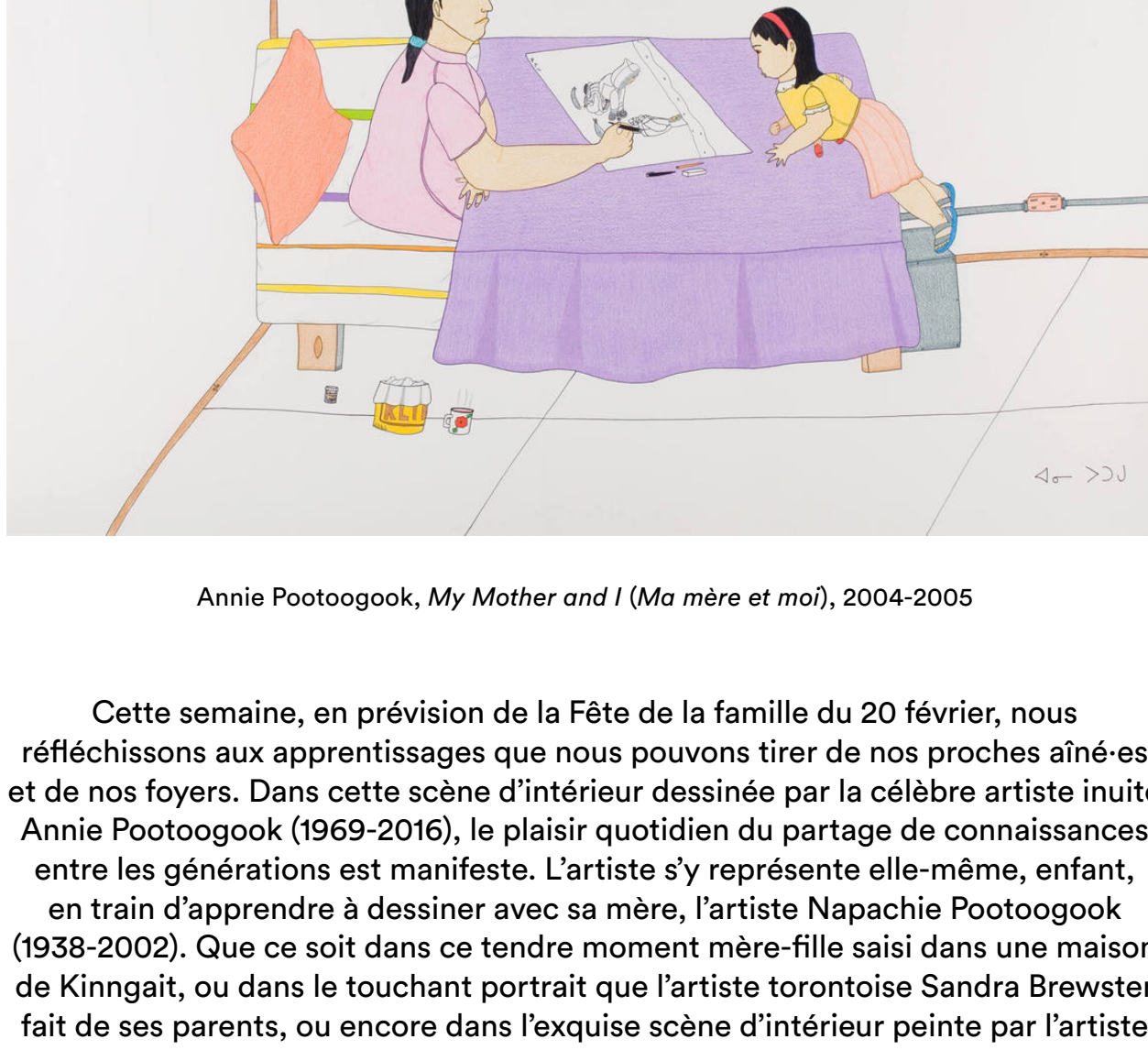
Annie Pootoogook, My Mother and I (Ma mère et moi) , 2004-2005

Mise en lumière des ressources de l'IAC destinées aux élèves du primaire